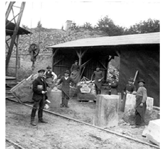
Seeberger Sandsteinbruch 1903

Mit seiner lateinisch verfassten Dissertation liegt der älteste urkundliche Nachweis in Thüringen zum Thema gefährliche Arbeitsbedingungen und Folgen für Leben und Gesundheit der Beschäftigten vor.